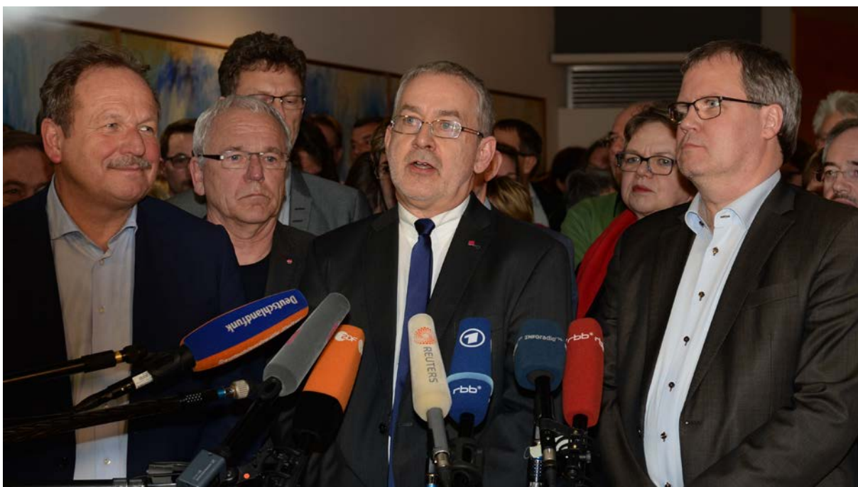
Die Verhandlungsführer erläutern das Ergebnis den Medien

Der dbb hält Wort gegenüber den rund 200.000 Lehrkräften in den Ländern der TdL. Mit der Vereinbarung der Entgeltordnung wird die Eingruppierung nunmehr bundesweit durch Tarifvertrag geregelt und künftig weiter ausgestaltet. Auf dieser Verhandlungsgrundlage gelingt zudem erstmals der Einstieg in weitere Höhergruppierungen für eine Vielzahl von Lehrkräften. Damit sind zentrale Forderungen umgesetzt, die insbesondere den Kolleginnen und Kollegen in ostdeutschen Lehrerzimmern seit langem auf den Nägeln brennen. Die Tarifeinigung für Lehrkräfte bietet in West und Ost allen Grund für eine positive Bewertung der Bestandteile des Potsdamer Lehrkräfte-Pakets.