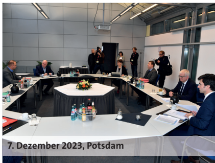
7. Dezember 2023, Potsdam