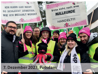
7. Dezember 2023, Potsdam

Beschäftigte in der Sozialen Arbeit in den Stadtstaaten erhalten eine monatliche SuE-Zulage in Höhe von 180,00 Euro. Diese Zulagen werden ab dem 1. Januar 2024 gezahlt.