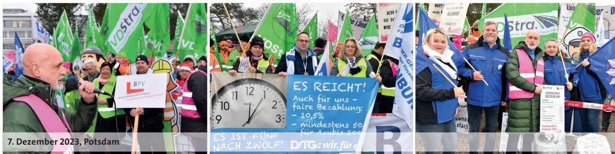
7. Dezember 2023, Potsdam