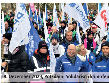
8. Dezember 2023, Potsdam: Solidarisch kämpfen GDL und dbb für ihre Ziele