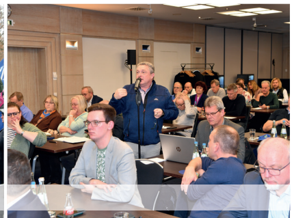
8. Dezember 2023, Potsdam: Solidarisch kämpfen GDL und dbb für ihre Ziele