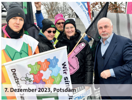
7. Dezember 2023, Potsdam